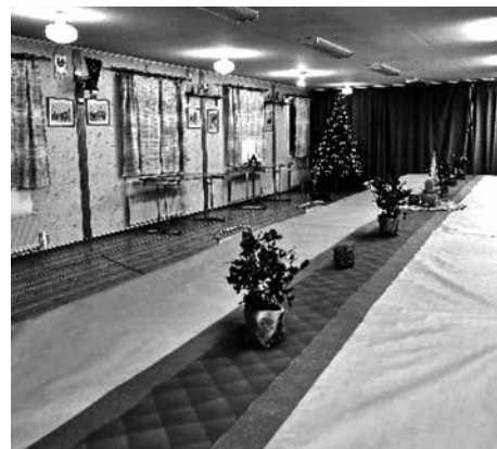
Julfint! på Välen

ning i lokalen. Onödiga och söndriga saker har rensats bort.